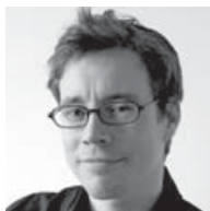
Dizajn: Fabian Zimmerli

Ďakujem všetkým, ktorí sa zúčastnili prác na tomto projekte: Delovi Xu za zaujatie a vytvorenie mostov medzi kultúrami, Johnovi Ye za technické spracovanie a Zengovi Ling Shangovi za prácu v CADe, Mariovi Rothenbühlerovi za fotografie, Fabianovi Zimmerlimu za jednoduchý dizajn a Mattimu Walkerovi za grafické práce.