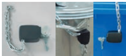
Typ: 0925-A1 až 0925-A5